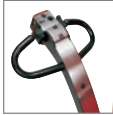
Δυνατότητα κίνησης με το μπράτσο στην όρθια θέση. Όλα τα χειριστήρια είναι εύκολα προσβάσιμα.

Η στιβαρή κατασκευή εγγυάται μεγάλη διάρκεια ζωής και χαμηλό κόστος συντήρησης.