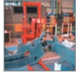
Διαθέσιμο με πλευρικούς ανατρεπόμενα πιρούνια ή/και επιπλέον εξοπλισμό, όπως γερανάκι, ανατροπέας βαρελιών, ανατροπέας ρόλλων, αυτόματος έλεγχος στάθμης, τηλεχειρισμός, ενσωματωμένος φορτιστής.