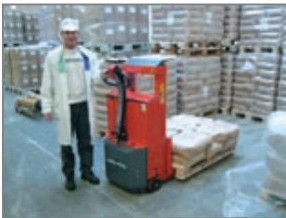
Διαφανές και ανθεκτικό κάλυμμα ιστού - Χαμηλή ταχύτητα με σηκωμένα πιρούνια.