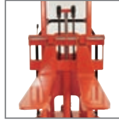
Τα ρυθμιζόμενα πιρούνια διατίθενται ως επιπλέον εξοπλισμός σε πολλά μήκη και τύπους.